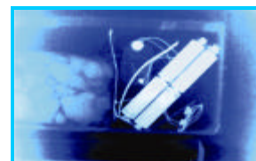
Imagen de dispositivo explosivo improvisado