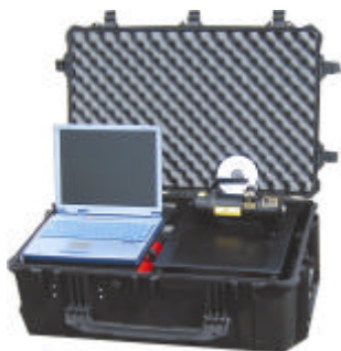
UNIDAD PORTÁTIL DE RAYOS X SCANTRAK EN SU ESTUCHE

SCANTRAK fue desarrollado para satisfacer la exigencia de nuestros clientes de una versión portátil de nuestros escáneres de rayos x en color SCANMAX. SCANTRAK es una solución portátil de vigilancia de alta calidad que proporciona una buena relación coste-